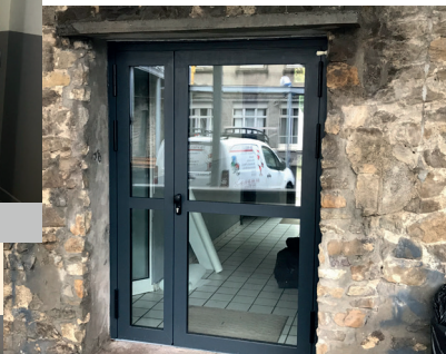
Accessibilité aux personnes à mobilité réduite