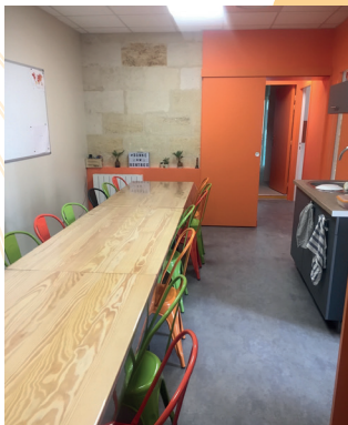
Rénovation : Cuisine des profs

Quelques photos illustrant des réalisations effectuées grâce aux aides versées par le Fonds de Dotation auprès de différentes écoles :