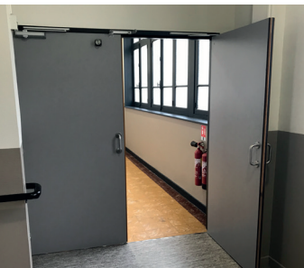
Sécurité : Porte coupe-feu