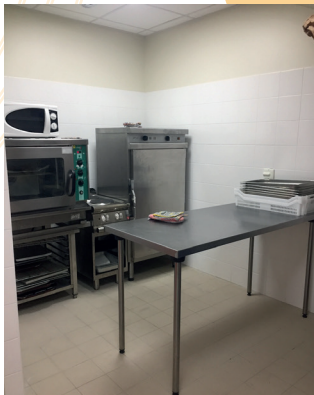
Mise aux normes alimentaires : Cuisine