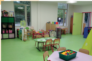
Équipement : Salle de classes