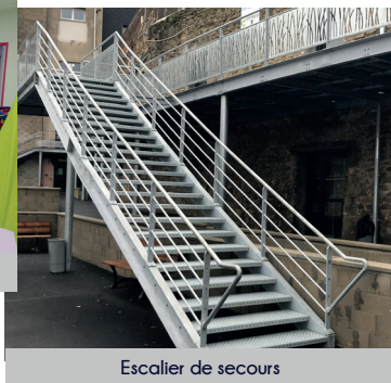
Escalier de secours